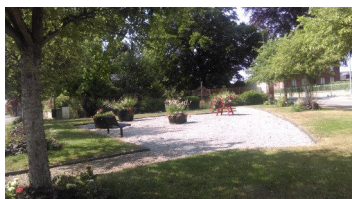
Petite place fleurie